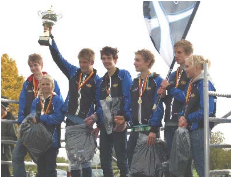
Segrare i Ungdomens 7-manna